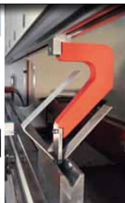
Variabler Rehfuß- stempel Variable goose neck