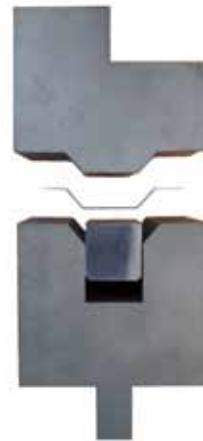
Trapezbieger Trapezoid tool