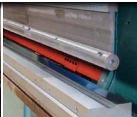
Konisches Lichtmastenwerkzeug Conical light-pole-tooling