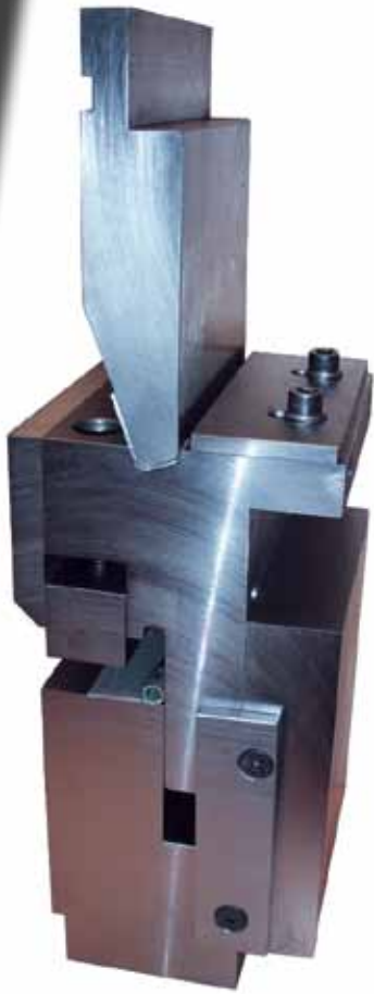
Scharnierwerkzeug Hinge tool