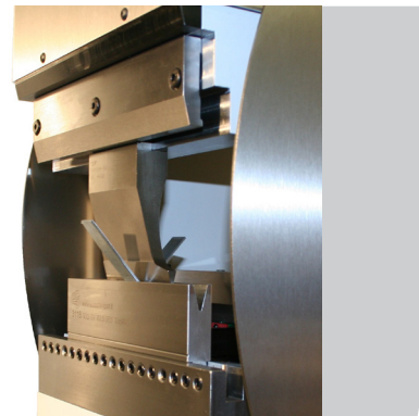
Ober- und Unterwerkzeugklemmung